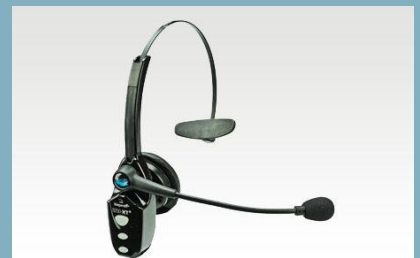
WXI Blue Parrot B250 XT+ headset

När det kommit 1 centimeter snö, har plogbilen normalt fyra timmar på sig att ploga sträckan. Fyra timmar efter avslutat snöfall ska det finnas åtminstone snö- och isfria hjulspår på vägen. Snösträngar kan alltså förekomma. Halkbekämpas normalt med salt.