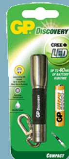
GP Discovery LCE202

Detta trots att det enligt EUs nya förordning nr 165/2014 artikel 34.3 b anges att intyget inte längre behövs. Men eftersom det vid kontroller i några av EUs medlemsstater fortfarande frågas efter detta intyg är det smidigare att ta med det ännu en tid! Mer information, de ändrade PM-en samt intyget finns att hämta på Transportstyrelsens hemsida. Har ni några frågor går det bra att höra av sig till lars.e.g.andersson@transportforetagen.se