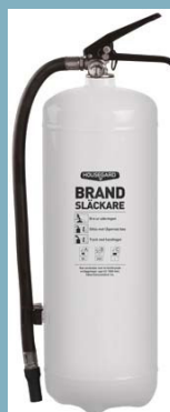
PE6TEA-SE BRAND-SLÄCKARE PULVER 6KG 55A 233B C