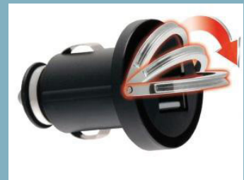
MobX USB adapter m 2 utg.12/24v 2.1A