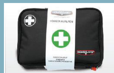
HOUSEGARD FIRST AID KIT BLACK "MELLAN"

Innehåller allt för sårvård och brännskador. Prisvärd och smidig.