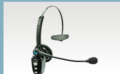
WXI Blue Parrot B250 XT+ headset

- Det är bra att alla LO-förbunden accepterar märket. Samtidigt är det ett problem att LO biter sig fast vid generella extra påslag utöver märket för stora grupper på arbetsmarknaden. Sverige behöver fler enkla jobb och en lägre arbetslöshet vilket motverkas av en låglönesatsning, avslutar han.