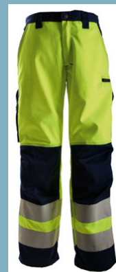
Midjebyxa klass 2