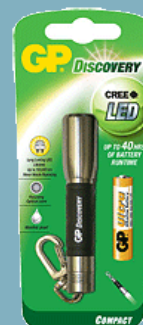
GP Discovery LCE202

"SIK Kompetenskrav Arbete på väg Entreprenader som åberopar kompetenskrav enligt SIK-modell (Skandinavisk Infrastukturkompetens) ska certifieras i fyra nivåer: Ø Nivå 2: Kompetenskrav för förare av vägunderhåll-, service- och arbetsfordon inklusive fordon med skyddsfunktion. Ø Nivå 3A: Kompetenskrav för utmärkningsansvariga. Ø Nivå 3B: Kompetenskrav för trafikdirigering vid vägarbete. Ø Nivå 4: Kompetenskrav för att styra och leda entreprenaden samt ansvar för trafik- och skyddsanordningar. Som hjälpmedel för att förbättra kompetensen inom ovanstående nivåer rekommenderar Trafikverket kunskap om innehållet i Trafikverkets tekniska råd för arbete på väg (TRVR APV(TDOK 2012:88)) och Trafikverkets broschyrer "Arbeta med väghållningsfordon - hur du ska varna, vägleda och varna för en säkrare arbetsmiljö" och "För din och trafikanternas säkerhetutmärkning och utsättning av vägmärken och skyddsanordningar vid vägarbeten". Beställ eller ladda ner materialet via Trafikverkets webbutik." Trafikverket.se/apv .