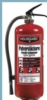
PE6GE-SE BRAND-SLÄCKARE PULVER 6KG 43A 233B C