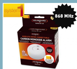
CA120WS Kolmonoxid detektor trådlös 868MHz (HG system1)