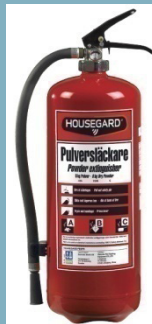
PE6GE-SE BRAND- SLÄCKARE PULVER 6KG 43A 233B C