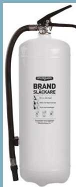
PE6TEA-SE BRAND- SLÄCKARE PULVER 6KG 55A 233B C