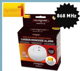
CA120WS Kol- monoxid detektor trådlös 868MHz (HG system1)