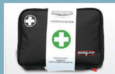
HOUSEGARD FIRST AID KIT BLACK ”MELLAN”

Innehåller allt för sårvård och brännskador. Prisvärd och smidig.